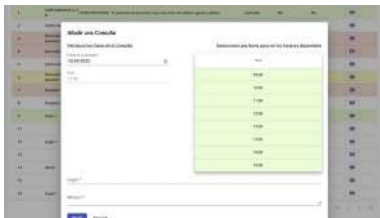
SSEC: Sistema de Seguimento de Enfermidades Crónicas é un sistema informático que ten como obxectivo o seguimento das enfermidades crónicas

Baixo o título Empresa familiar e sostibilidade , a Cátedra de Empresa Familiar da Universidade de Vigo desenvolverá este curso académico un ciclo de conferencias no que representantes do sector en Galicia exporán a súa experiencia en accións de circularidade económica, entendendo por circularidade económica a estratexia centrada na redución tanto do consumo de novas materias primas como da produción de residuos. +info.