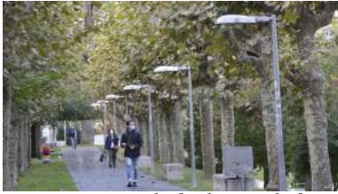
Os resultados foron probados no alumeamento LED instalado no campus de Ourensego