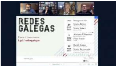
O ciclo desenvólvese a través de Campus Remoto

Co obxectivo en primeiro termo de dar servizo ás materias relacionadas con deportes náuticos que se imparten na Facultade de Ciencias da Educación e do Deporte, pero co propósito tamén de que se converta nunha instalación para o conxunto da cidadanía, a Vicerreitoría do campus acometeu a comezos de ano as obras de instalación dun embarcadero na marxe norte do río Lérez. Mais esta actuación completouse poucos días antes de que se decretase o estado de alarma o que, sumado á suspensión da actividade docente presencial, impediu que o embarcadero se puxese en funcionamento ata comezos do presente curso. +info.