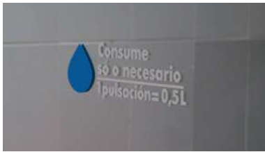
Un dos adhesivos colocados nos baños dos centros