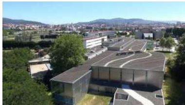
A planta situarase entre as facultades de Ciencias Sociais e da Comunicación e Ciencias da Educación e do Deporte