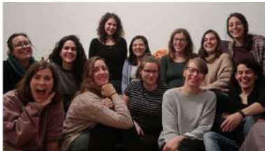
Foto das mulleres científicas do grupo local do proxecto Soapbox Science Berlin, participantes nesta iniciativa