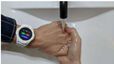
Os sensores dos reloxoos intelixentes envían os datos a unha app para ser analizados por un algoritmo de clasificación