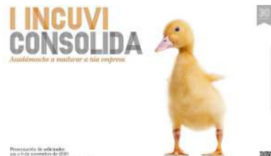
A Universidade de Vigo amplía este curso as axudas Incuvi ao emprendemento cunha terceira modalidade: Consolida