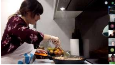
O curso de cociña virtual foi a primeira das actividades en pórse en marcha