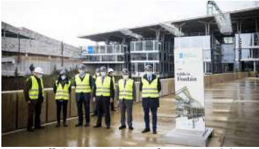
O conselleiro e os reitores durante a visita ao edificio