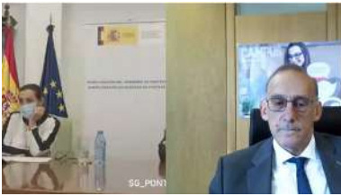
Larriba e Reigosa presentaron este convenio nunha rolda de prensa virtual