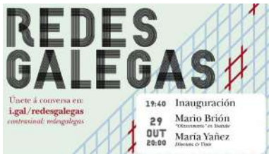
O ciclo 'Redes Galegas' desenvolverase a través de Campus Remoto