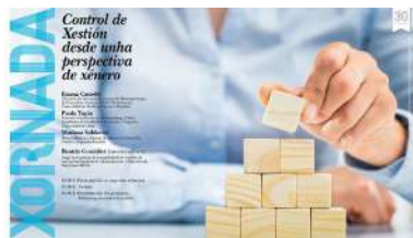
Cartaz da actividade

A crise sanitaria impediu que a Facultade de Ciencias Sociais e da Comunicación celebrase o pasado curso o Día das Redes Galegas, unha xornada dirixida a analizar a importancia das redes sociais dentro da comunicación do século XXI e o papel que estas poden xogar á súa vez na difusión do galego. Este evento, que adoitaba celebrarse nas semanas previas ao Día das Letras Galegas, reconvértese agora no ciclo de coloquios virtuais Redes Galegas que, a través de Campus Remoto, terá lugar os días 29 de outubro e 5 e 12 de novembro. +info .