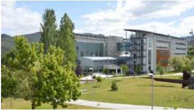
A actividade está organizada pola Cátedra de Empresa Familiar, que ten a súa sede na Facultade de Ciencias Empresariais e Turismo