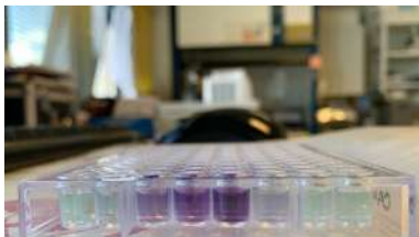
Imaxe dos traballos de laboratorio que se están realizando no marco do proxecto