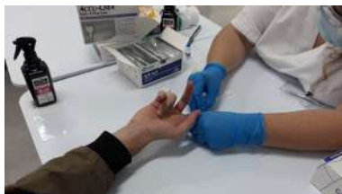
O Sergas facilitou á UVigo 15.000 test rápidos de detección en sangue

O vindeiro mes de novembro entrarán previsiblemente en funcionamento dúas plantas fotovoltaicas, unha na Escola de Enxeñaría de Minas e Enerxía e outra na Escola de Enxeñaría Industrial. Voltfer, división do Grupo Alvariño especializada en solucións en enerxías renovables, será a encargada da instalación das plantas que suman unha potencia conxunta de 320 kW/ano e permitirán a produción de 390.000 Kwh/ano. +info.