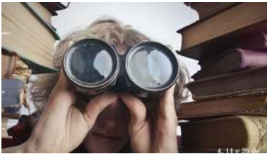
As conferencias terán lugar os días 4, 11 e 26 de novembro