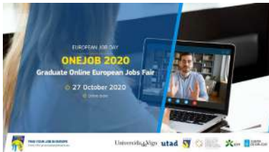
Captura do espazo web desta nova feira de emprego