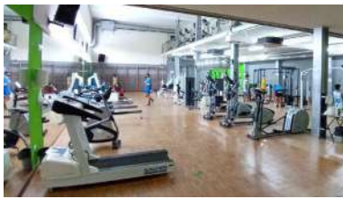
As actividades desenvólvense en instalacións do campus