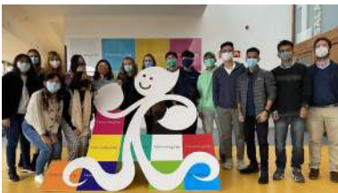
Foto de familia do alumnado participante na 5ª edición de Campus Spain

Nun curso marcado pola pandemia da covid-19 e no que o medo a novos confinamentos frea en moitos casos os desexos dos estudantes de realizar estancias internacionais, o campus de Vigo deu este luns a benvida a un grupo de 16 mozas e mozos asiáticos que permanecerán na cidade ata o vindeiro mes de xullo. Son os integrantes da 5ª edición de Campus Spain, un proxecto centrado na promoción de España como destino educativo e en labores de asesoramento a alumnado internacional, tanto na xestión de visados como de permisos de estancia ou a admisión en universidades españolas. +info .