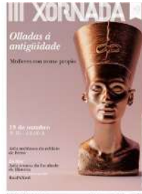
Cartaz da actividade