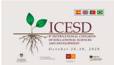
O congreso desenvolverase, de xeito virtual, entre o 28 e o 30 de outubro