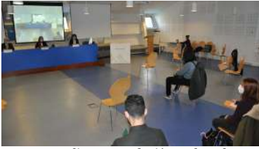
Realizaron traducións culturalmente adaptadas, cursos e unha guía de boas prácticas